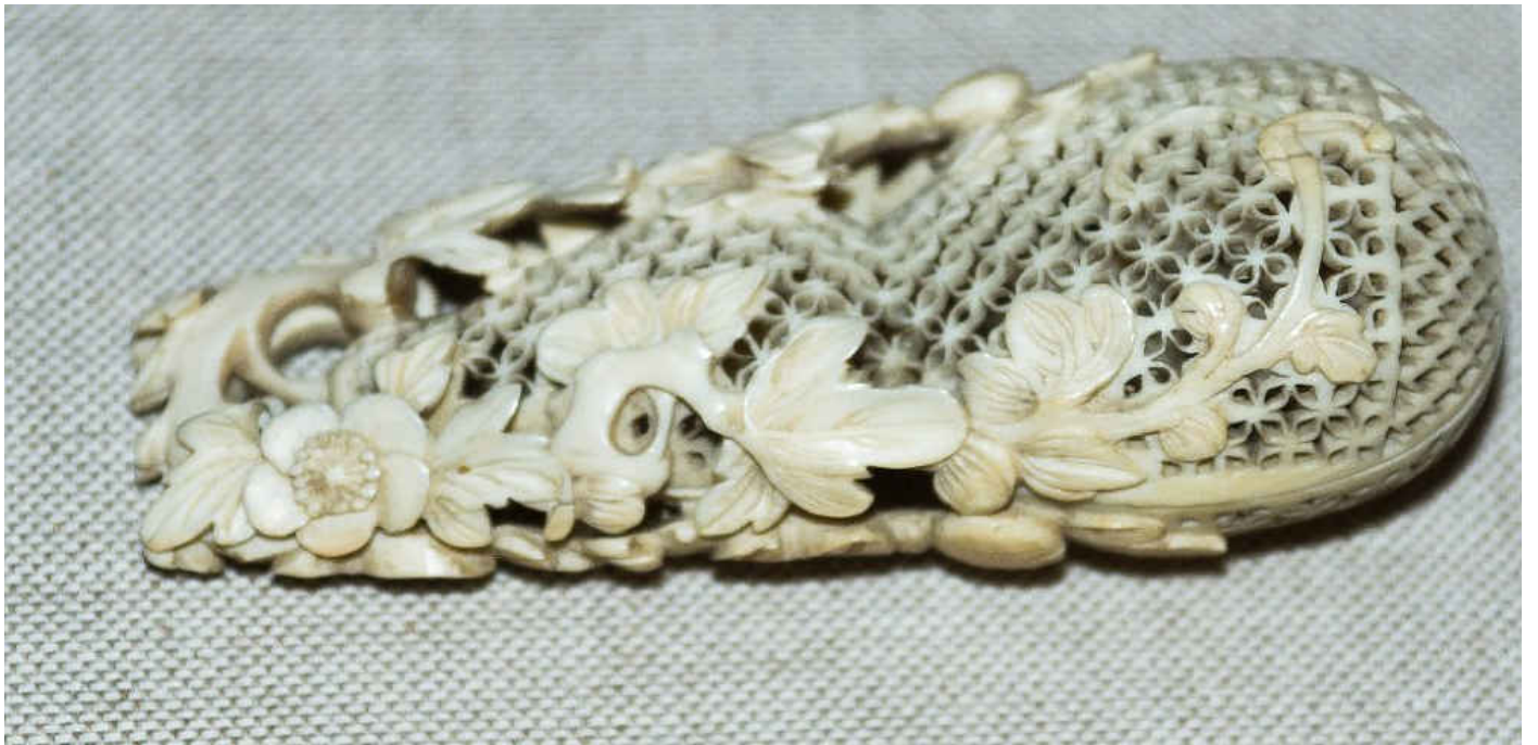
Elfenbeingeschnitzter Behälter für Riechfläschchen.